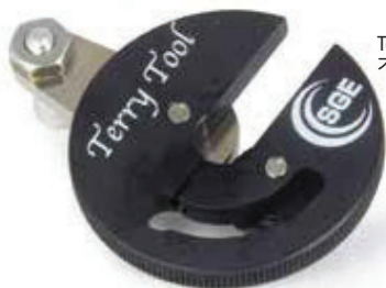
Terry Tool 不锈钢切管器

Terry Tool 是适用于外径为 1/16 或 1/8 英寸的玻璃衬套管路或不锈钢管的小型切管器。经过特殊硬化的切割轮能够实现干净的直角切割, 同时更大幅度地减少管路的毛刺或碎片。大多数 GC 和 MS 以及所有 HPLC 管路应用的零死体积连接都很容易实现。