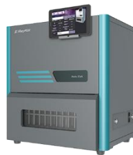
全自动平行浓缩仪 浓缩