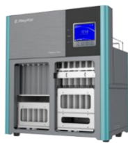
高通量全自动固相萃 取仪 净化