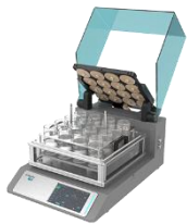
高通量真空平行浓缩 仪 浓缩