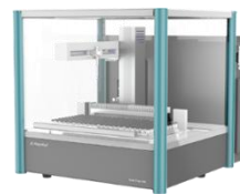
全自动液体样品处理工 作站 标液配制