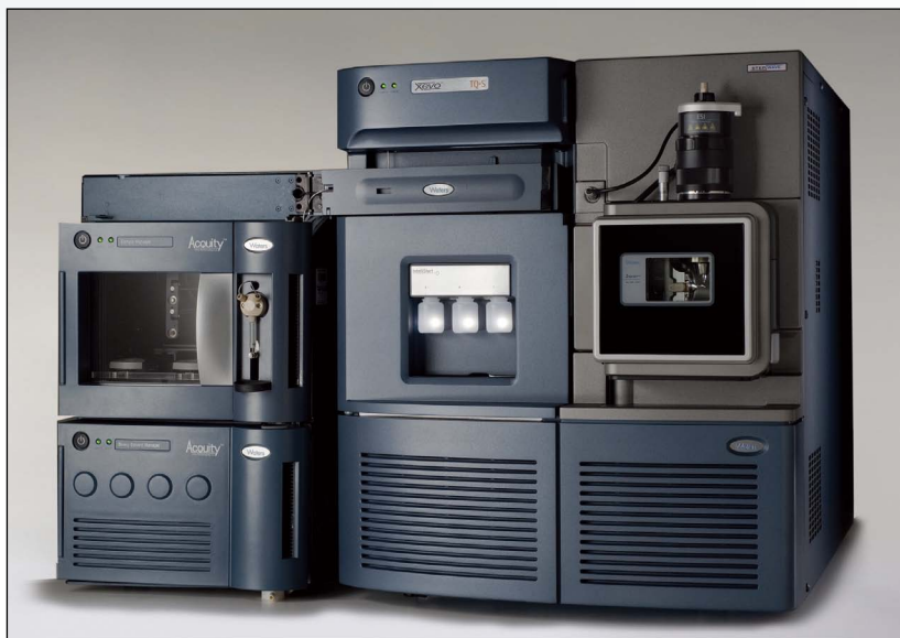
图1. 配备Xevo TQ-S的ACQUITY UPLC系统。