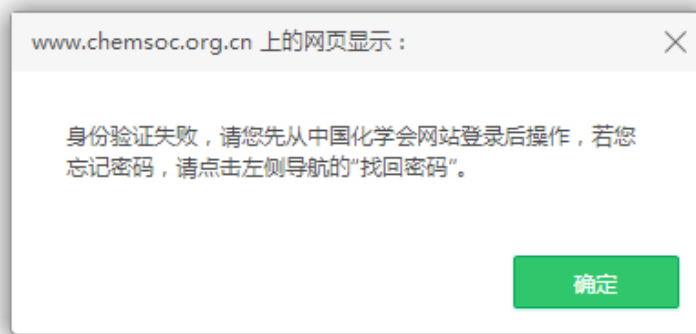
图 6 身份验证失败提示