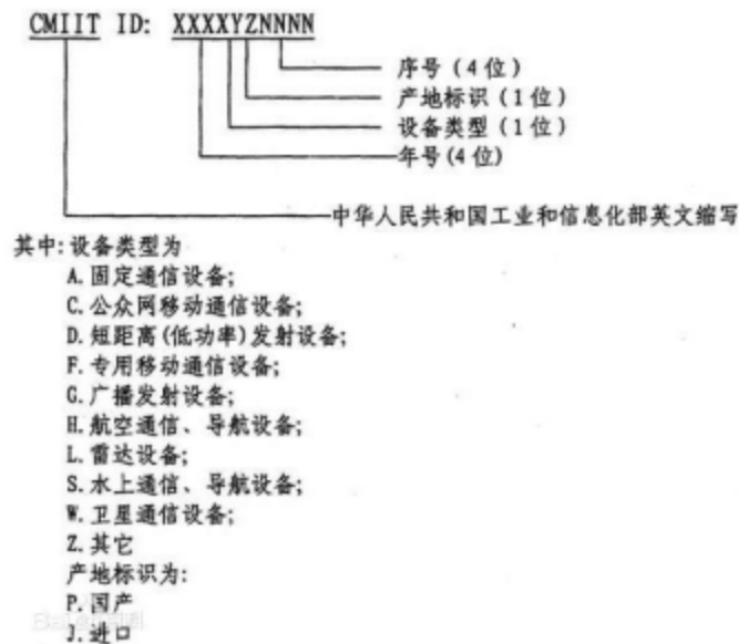
图 CMIIT ID样本(仅供参考)