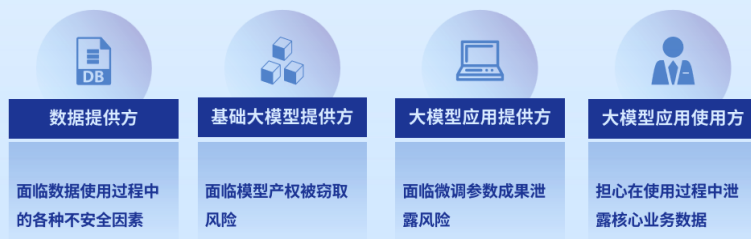
图5 各类主体面临的安全风险

大模型训练及应用通常涉及四类参与主体,均存在安全需求。大模型开发及应用全流程通常涉及数据提供方、大模型应用使用方、基础大模型提供方、大模型应用提供方四类参与主体。它们在合作过程中需要解决信任及隐私安全保护问题。数据提供方面临数据使用过程中的各种不安全因素;大模型应用使用方担心在使用过程中泄露核心业务数据,该担心并非空穴来风,例如2023年三星设备解决方案部门因使用ChatGPT导致半导体设备测量、良品率/缺陷、内部会议内容等相关信息被上传到ChatGPT服务器中,造成广泛负面舆论;基础大模型提供方面临模型产权被窃取风险,特别是对于初创企业而言,基础模型是公司的核心资产;大模型应用提供方面临微调参数成果泄露风险。