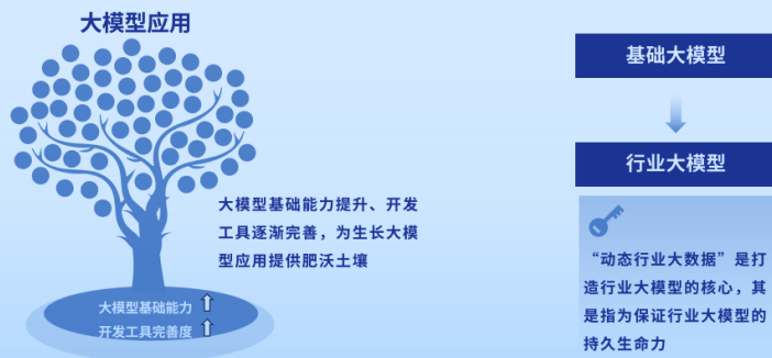
图3 大模型应用搭建难度下降，“动态行业大数据”成为落地关键

动态行业数据成为大模型落地新关键。 基础大模型一般是基于广泛的公开文献与网络信息来训练的，属于“泛行业”，没有特定行业属性，导致基于其搭建的上层应用在专业和细分领域难以提供高价值服务。因此，打造行业大模型成为需求方和技术企业的共同关注点。具体而言，“动态行业大数据”是打造行业大模型的核心，其是指为保证行业大模型的持久生命力，技术企业应具备动态更新行业大数据的能力，而非只掌握一批“静态数据”。拥有“动态行业大数据”的技术企业更容易获得需求方青睐。