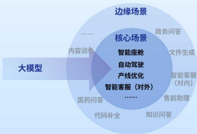
图1 大模型穿越边缘场景，向核心场景挺进

这些检索出的信息作为提问的上下文构建提示词，大模型再基于提示词进行归纳总结，生成答案，检索增强生成技术主要用于解决大模型幻觉问题。智能体技术则可以实现大模型应用的能力升级，例如，类似ChatGPT的大模型应用仅能起辅助作用，而智能体技术可以赋予大模型感知、规划、记忆和使用工具的能力，实现独当一面。多模态技术使得交互模态不局限于单一的文本模态，而是扩展至文本、图片、音频、视频等多种模态，可显著提升大模型应用的产品功能和交互体验，推动大模型应用从可用向好用转变。