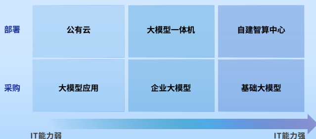
图4 需求方IT能力对采购和部署方式的影响

需求方IT能力越强,越具备在智算中心私有化部署大模型的条件,反之则更依赖大模型一体机和公有云部署。 强IT能力需求方通常已自建智算中心,其具备高端GPU资源,支持大模型的训练和推理工作。IT能力稍弱的需求方通常采用大模型一体机,其仍为私有化部署模式,由技术企业对大模型、应用、算力资源进行整合,形成端到端解决方案,便于大模型在需求方快速落地。IT能力更弱的需求方通常倾向公有云部署,此种方式更省心且初始投入较低,有利于需求方低成本快速试错。