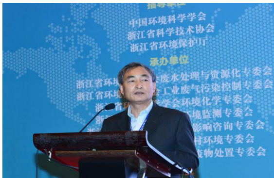
浙江省环科院院长金钧