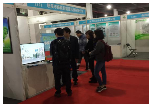
慈溪绿能产品介绍

2016 浙江环博会搭建了专家与企业的技术对接交流平台，展会前期对环保企业开展企业需求调查，了解环保企业目前存在的难题，展会期间邀请了相关的国内外环保行业权威专家与环保企业一对一洽谈，解决环保企业的技术难题，专家涵盖大气、水、土壤修复、固废治理等环保各领域，吸引了众多环保企业与观众到“企业与专家交流区”咨询，为 2016 浙江环博会锦上添花，2016 浙江环博会不仅为企业提供一个展示新产品、新技术、新工艺的平台，更是切合实际的解决了企业存在的技术难题，对环保企业的生存发展及环保行业的发展都起到了重大的促进作用。