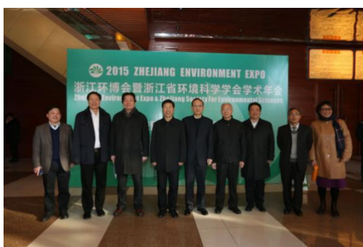
省环保厅相关领导参观浙江环博会