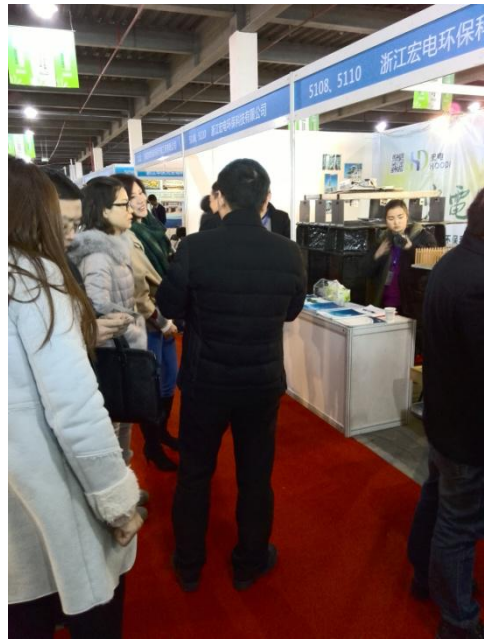
环博会现场人气爆满