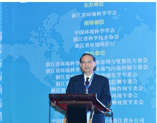
浙江省厅副巡视员陈爱民年会上报告