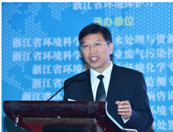
浙江省厅副厅长卢春中年会上作报告