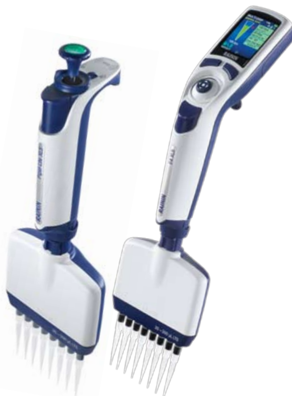
Pipet-Lite XLS+与E4 XLS+型号

凭借Rainin E4 XLS+电动多道移液器加快孔板处理速度。提高分配多种样品的效率，可进行序列稀释以及序列量程移液的预设。