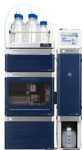
(本品包含选配件及用户自行配置配件)