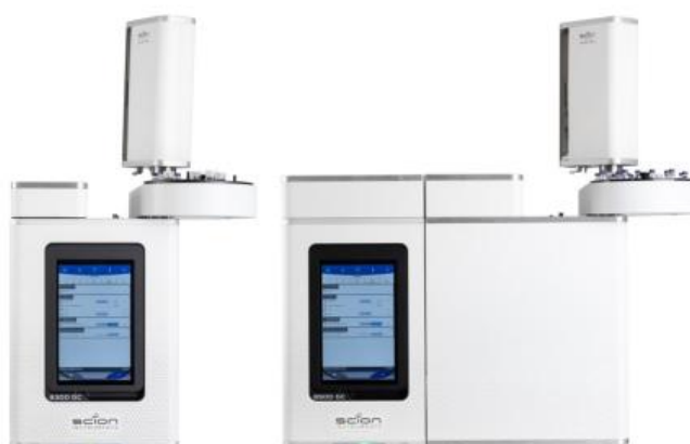
图1 SCION(赛里安) 8300GC、8500 GC 平台配 8400PRO 自动进

本应用适用于 SCION (赛里安) 4X6 和 8X00 GC 平台，图 1 显示了 SCION 8X00 GC 平台。