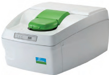
图1.DSC 8000型差示扫描量热分析仪。该仪器的高灵敏度和优异的温度控制性能使其成为光固化研究等要求较高的应用的理想选择。