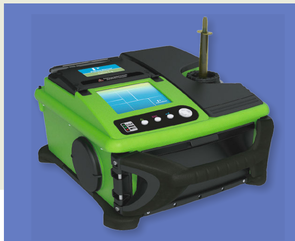
Torion T-9 Portable GC/MS

多年以来，已有许多类型的分析仪器发展成便携式或手持式仪器来使用，包括荧光光谱仪、激光诱导击穿光谱仪、拉曼光谱、傅立叶变换红外和近红外光谱分析仪。然而，将气相色谱 / 质谱仪缩小成便携式结构，同时拥有实验室级仪器的分析性能，是一个巨大的挑战。以前的大多数尝试都使用“点对点”直接进样方法，其不需要任何的样品处理或样品进样配件。如果样品需要复杂的样品处理或需要精细的进样程序进到气相色谱仪，那便携式仪器的实用价值将明显降低。本文中新型的便携式气相色谱 / 质谱仪（Torion®T-9，PerkinElmer Inc.，Shelton，CT）被用来快速筛查半挥发性有机物（SVOCs），尤其特别的是分析水中的酚类和邻苯二甲酸酯类化合物的时间不到 10 分钟。