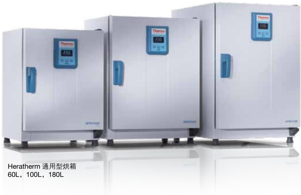
Heratherm 通用型烘箱 60L, 100L, 180L