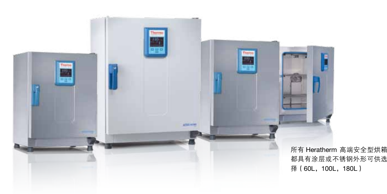
所有 Heratherm 高端安全型烘箱都具有涂层或不锈钢外形可供选择（60L，100L，180L）

Thermo Scientific Heratherm 高端安全型产品结合了高端型的优点，并增加了额外的产品安全特征，可提供最佳的稳定性和样本保护。