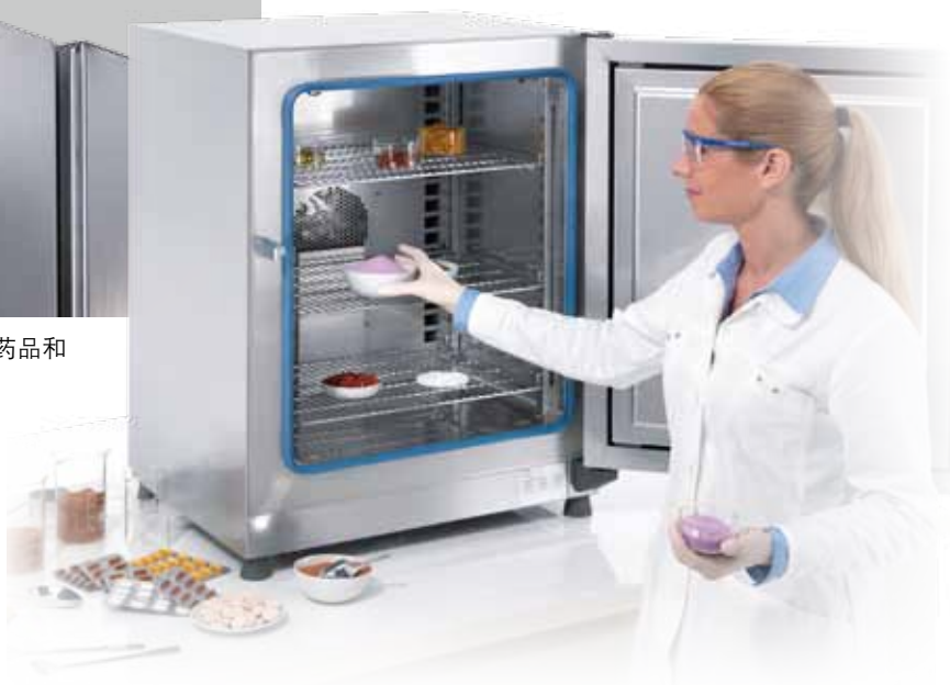
规格表 / 订单号 高端烘箱