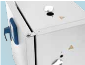
顶部接入口和右侧接入口

请订购我们的专门解决方案。我们可提供用于电缆试验和洁净室的 Heratherm 台式烘箱，以及用于惰性气体应用的气密性内壳。对于大容量烘箱，我们可根据您的应用要求在您指定的位置设置附加接入口。