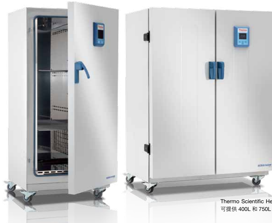
Thermo Scientific Heratherm 大容量 可提供 400L 和 750L 的烘箱

Thermo Scientific Heratherm 大容量通用型烘箱专为大型样品或大体积样品而设计。 通用型烘箱容量大，可满足您的日常干燥与加热应用。