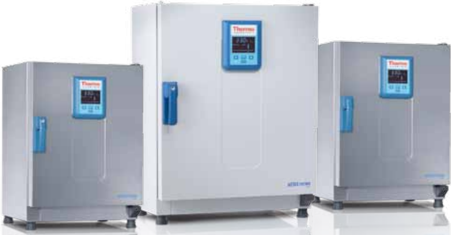
Heratherm 高端型烘箱 60L, 100L, 180L

Thermo Scientific Heratherm 高端型号包括了通用型烘箱的所有优点，同时还提供了其他附加功能，具有更大的灵活性、准确性和可靠性。