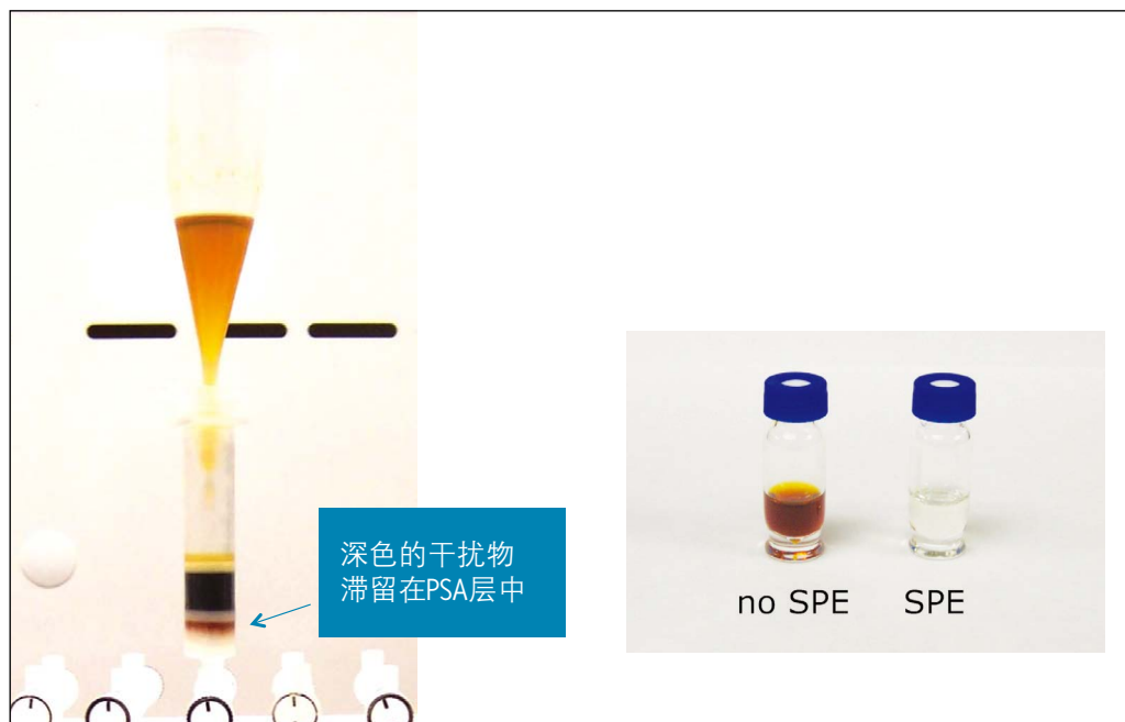
图3. GC-MS分析中利用Sep-Pak PSA/carbon小柱对QuEChERS茶叶萃取液进行净化。左图所示为样品流经小柱的净化过程，右图样品瓶为两种净化结果。

GC-MS的SPE净化方法十分高效，可在GC-MS分析之前去除QuEChERS萃取液中的全部有色成分。实验中，首先在SPE小柱上加载1 mL QuEChERS萃取液，然后用10 mL丙酮/甲苯进行洗脱。但是，如果在上样之前以10 mL丙酮/甲苯溶液对1 mL QuEChERS萃取液进行稀释，可获得更好的净化效果。对于未使用SPE净化的GC-MS分析而言，在分析较少的样品后就需要对进样口和色谱柱进行维护。使用dSPE净化后，可分析上百个样品后再进行维护。图3所示为QuEChERS萃取液的Sep-Pak PSA/carbon净化图。